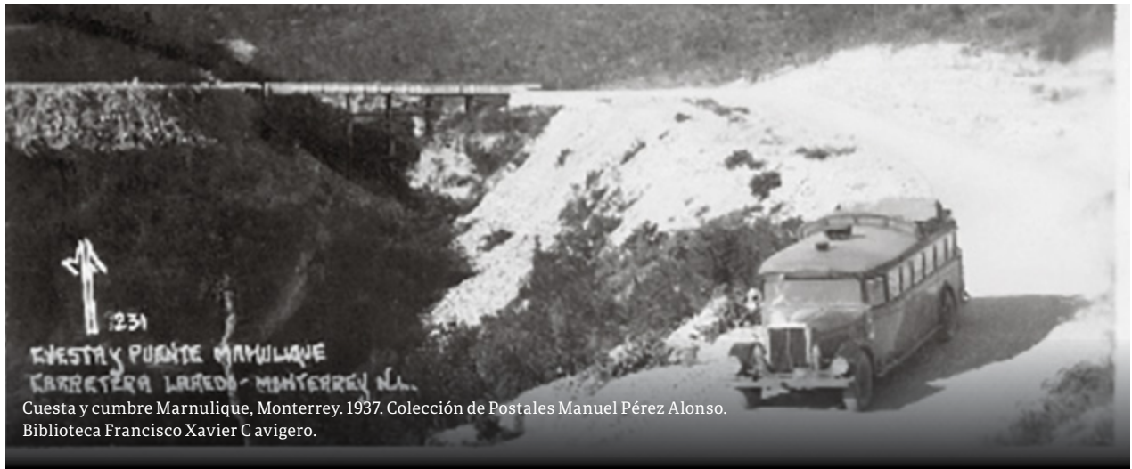
Cuesta y cumbre Marnulique, Monterrey, 1937. Colección de Postales Manuel Pérez Alonso. Biblioteca Francisco Xavier Clavigero.

La postal cumplió con la función para la cual se creó: llevar la economía de la comunicación a un nivel global, pero también ser una herramienta de cohesión social, fortalecer el nacionalismo, alentar el turismo y mejorar la imagen de México. Es así que la riqueza de la Colección de Postales de Manuel Pérez Alonso, nos lleva por un viaje al México de inicios del siglo XX.