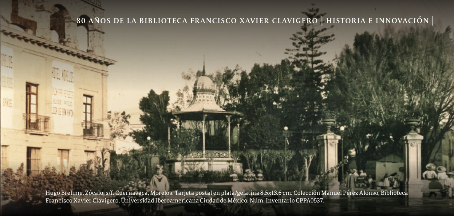
Zócalo, s/f. Cuernavaca, Morelos. Tarjeta postal en plata/gelatina 8.5x13.6 cm. Núm. Inventario CPPA0537.