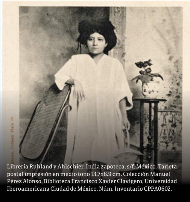
Librería Ruhland y Ahlschier. India zapoteca, s/f. México. Tarjeta postal impresión en medio tono 13.7x8.9 cm. Núm. Inventario CPPA0602.

hombres y mujeres sentados en las bancas de la plaza central dando la espalda al fotógrafo. La mirada tierna del pequeño niño, la arquitectura y la escena de la vida cotidiana que tiene detrás, ilustran la diversidad cultural de México. La Revolución mexicana y, particularmente la Revolución del sur en el estado de Morelos, acaparó la atención del mundo y aumentó la demanda por publicar fotografías de acontecimientos, mercados, pueblos, gente y ambientes rurales y tipos mexicanos.