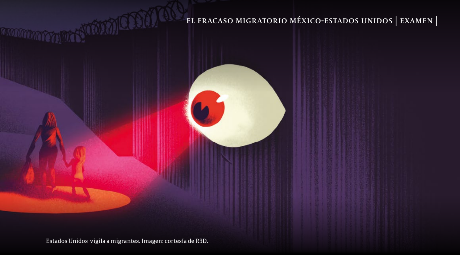
Estados Unidos vigila a migrantes.

Para Estados Unidos la vigilancia de su frontera sur adquirió mayor preocupación cuando brotaron los frutos de su intervencionismo. Los procesos de despojo producidos por el sistema de producción neoliberal y el intervencionismo estadounidense en Latinoamérica generaron condiciones de explotación en todos los niveles.