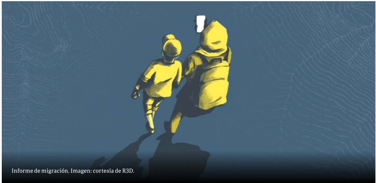
Informe de migración.